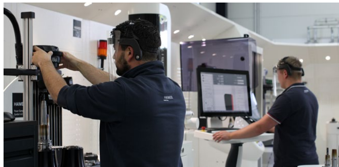
Werkzeugmanagement Tool Management