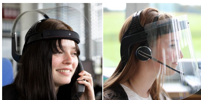
Büro am Telefon oder mit Headset Office with phone or headset