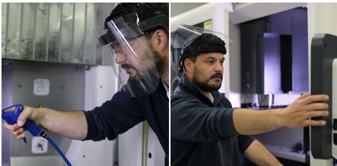
Handhabung inner- und außerhalb der Maschine Handling in and outside of machine tool